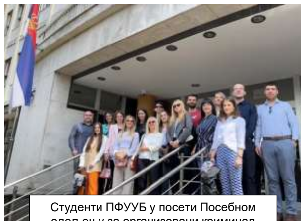
Студенти ПФУУБ у посети Посебном одељењу за организовани криминал Вишег суда у Београду