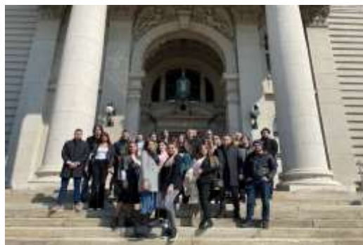
Студенти ББА у посети Народној скупштини РС

Факултети прате потребе тржишта рада, посвећују посебну пажњу организовању стручне праксе за студенте и облике наставе који подржавају укључивање студената у праксу.